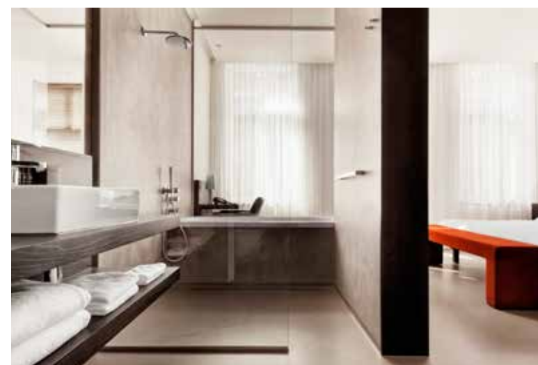
Boven Restaurant Witloof, onlangs gerestyled door Maurice Mentjens Links Minimalisme in Hotel Beaumont Rechts De vijftiende eeuw en futuristisch design komen samen in het Kruisherhotel

Bakkerij Hermans Nou vooruit, omdat we je niet naar huis kunnen laten gaan zonder rijstevlaai, tippen we nog de beste plek om die te kopen (we hebben het van de Maastrichtenaren zelf): Bakkerij Hermans in de Zakstraat.